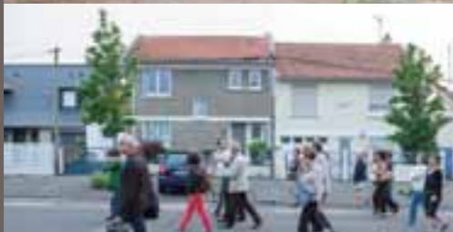
Cœur de quartier

Le quartier dispose de nombreuses qualités. Lors de la réunion publique, première étape de la concertation, les participants ont pu re-découvrir le secteur et ses différentes identités afin de mieux appréhender les potentiels du quartier et les enjeux du projet.