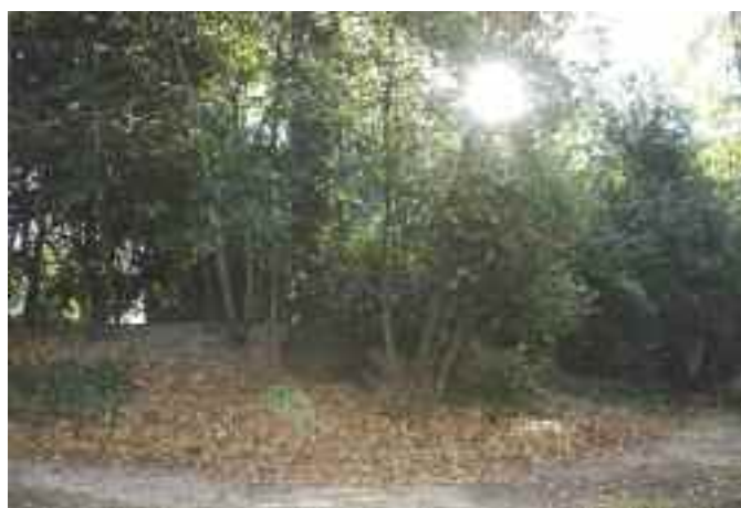
Le parc Say, un espace de loisirs et de promenade pour les habitants du quartier.