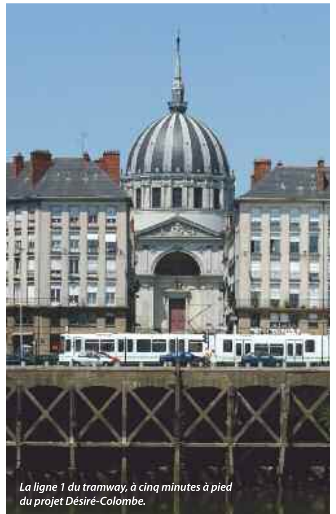
La ligne 1 du tramway, à cinq minutes à pied du projet Désiré-Colombe.