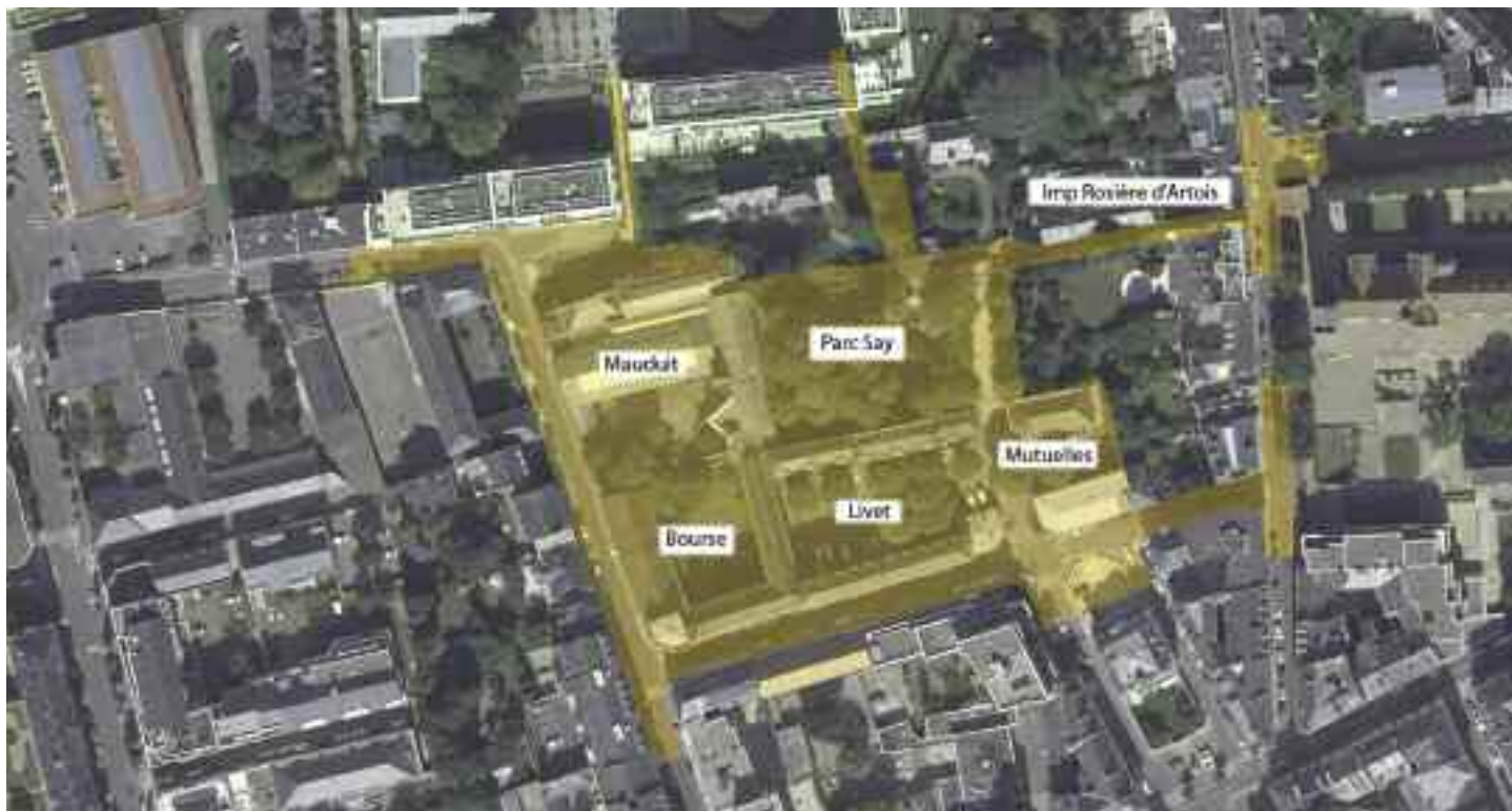
Le périmètre de l'opération

Le site Désiré-Colombe fait partie de ces lieux qui ont profondément marqué l'histoire et la mémoire des Nantais : les fêtes aux Salons Mauduit où se pressait le Tout-Nantes ; les meetings syndicaux emblématiques de l'histoire sociale de la ville... Le projet d'aménagement du site va permettre la réhabilitation et la mise en valeur de ce patrimoine historique du début du siècle dernier.