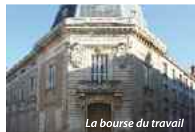
La bourse du travail

À l'horizon 2016, les immeubles Bourse et Livet seront transformés en un pôle associatif de quelque 3000 m 2 . Géré par la Ville de Nantes, il proposera différents espaces adaptés aux besoins des associations : salles de danse et de gymnastique, ateliers, espaces d'exposition, grandes salles de commission, salles de réunion... Le pôle hébergera également une trentaine d'associations. Par sa situation au cœur du centre-ville, par son importance aussi, le futur pôle associatif aura un rayonnement social et culturel à l'échelle métropolitaine.