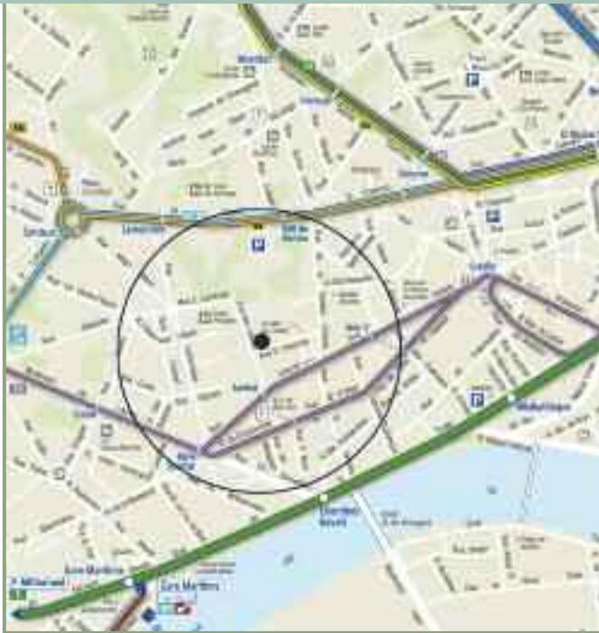
Quatre offres de transports publics à proximité pour faciliter la mobilité des riverains.