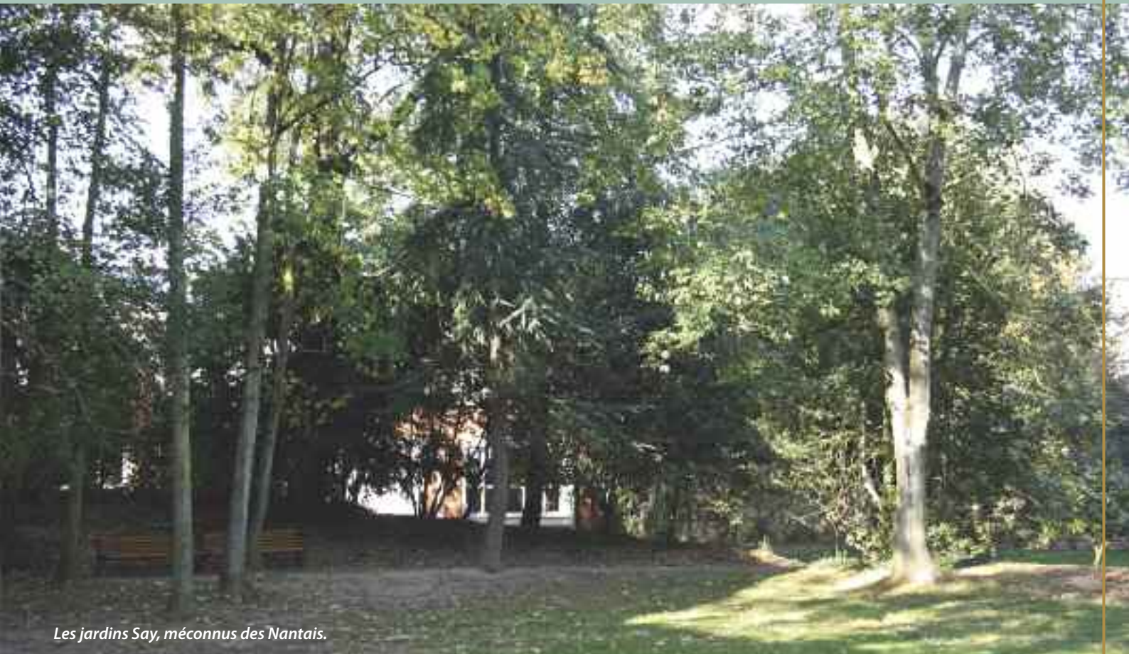
Les jardins Say, méconnus des Nantais.