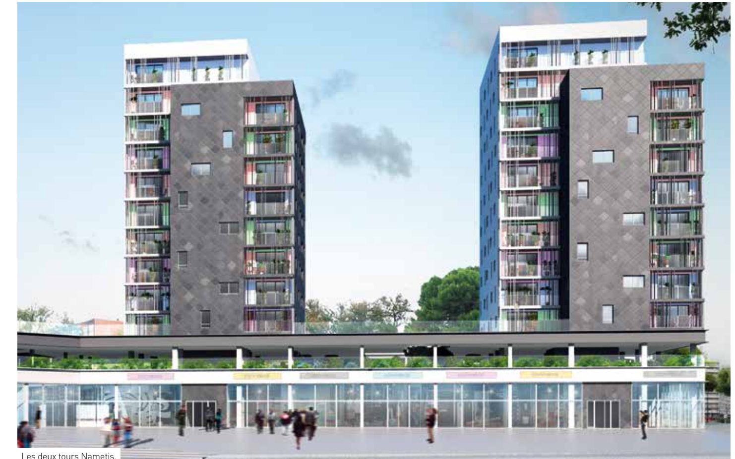
Les deux tours Namétis.