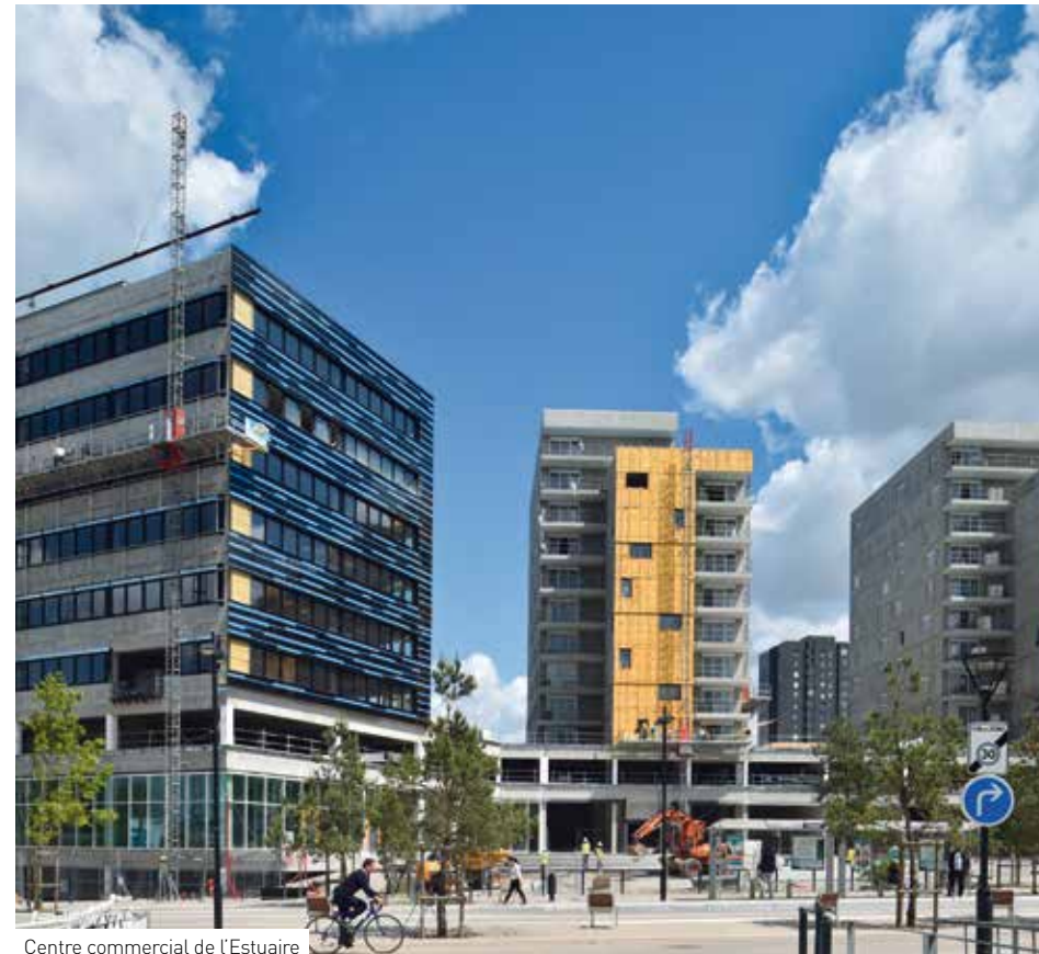
Centre commercial de l'Estuaire.

Le nouveau cœur de Malakoff/Pré-Gauchet a été conçu pour offrir à chacune et à chacun une qualité de vie dans un quartier intégré à la ville, avec une qualité des espaces publics et des logements, et des services facilement accessibles par toutes et tous. Ainsi, après l'ouverture du pont Éric-Tabarly, l'aménagement du boulevard de Berlin et la mise en route de la Maison des Haubans qui ont permis de renforcer l'ouverture du quartier sur le reste de la ville, tout un ensemble de commerces et d'activités vont s'organiser autour d'une place centrale. Elle fera le lien entre Malakoff et le secteur du Pré-Gauchet à vocation plus tertiaire mais qui accueille aussi de plus en plus de logements.