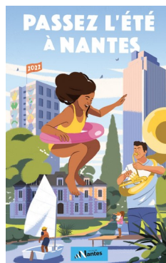
Le guide de l'été 2022

- les associations se font aussi le relais de toute l'offre municipale et associative.