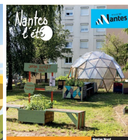
Agenda de quartier Nantes Nord Juin | Juillet | Août 2022