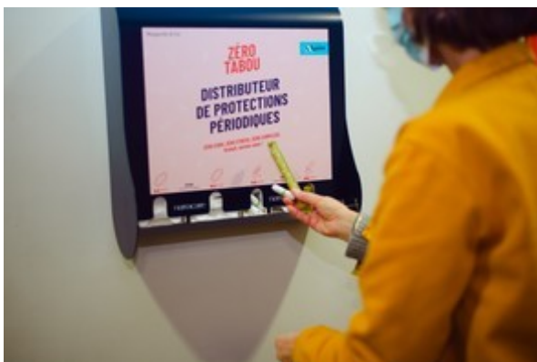
Exemple de distributeur installé

L'objectif est de permettre à toutes les personnes qui ont leurs règles et qui en ont besoin, quels que soient leur âge, leur situation ou la raison (financière, dépannage, etc.), de trouver facilement des protections périodiques (serviettes et tampons avec et sans applicateur) gratuites et de qualité (biologiques, dans la mesure du possible biodégradables, sans plastique, sans produit chimique, sans parfum ou sans colorant).