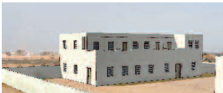
Le futur centre de formation de Rufisque.

Le bâtiment (190 m 2 sur deux niveaux), s'élève dans l'enceinte de la Maison des associations où sont dispensés les cours actuellement. À la rentrée 2008, les élèves emménageront dans leurs nouveaux locaux. La forte implication locale, la