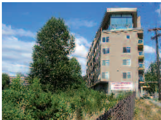
Des éco-quartiers en construction pour lutter contre l'étalement urbain et les embouteillages -ici South Lake Union.

Nantes a accueilli, les 5 et 6 novembre, le groupe environnement du Conseil des communes et régions d'Europe (CCRE). Cette organisation représente plus de 100 000 villes et régions de 35 pays et vise à influencer la législation européenne pour que l'avis des autorités locales soit pris en compte. Or, l'Union européenne est la principale source d'orientation des politiques nationales environnementales. Cette session a rassemblé vingt-cinq élus et techniciens d'une quinzaine de pays et a permis d'échanger sur plusieurs directives et textes portant sur les déchets, l'adaptation au changement climatique, l'eau, les risques d'inondation, l'air, la stratégie européenne en matière de développement durable. La Ville de Nantes et Nantes Métropole ont pu témoigner de leurs expériences en matière d'Agenda 21, de plan climat, de gestion de l'eau, d'éco-quartiers ou encore de gestion des déchets. ●