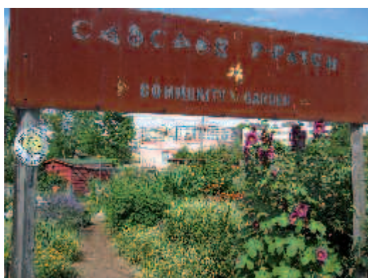
2 000 parcelles de jardins familiaux cultivées 100% en bio.