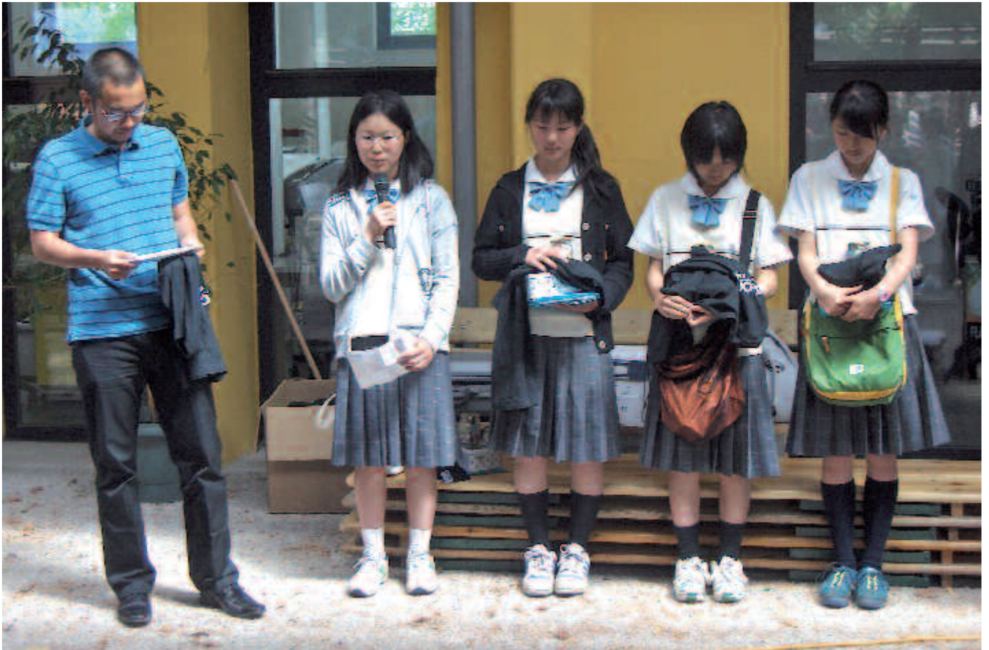
Les jeunes japonaises présentent leur travail au public nantais.

Du 9 au 20 juillet dernier, des jeunes Nantais et Japonaises se sont retrouvés pour un séjour de vacances organisé par l'ACCOORD-ALIS dans le cadre de la Biennale internationale "Estuaire 2007".