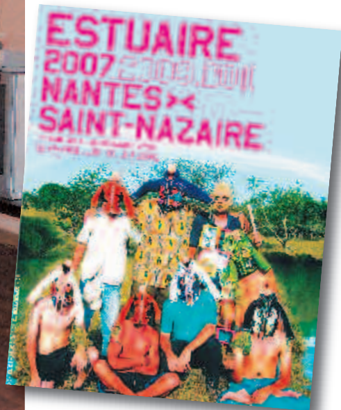
Entre Nantes et Niigata, la culture est un levier fort de coopération. Ici, l'installation de la place Royale lors d'Estuaire 2007.