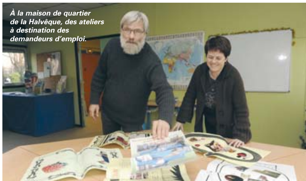
À la maison de quartier de la Halvêque, des ateliers à destination des demandeurs d'emploi.

Tai-chi, sophrologie, yoga, rigologie, initiation à l'informatique et au cyberspace de la Maison de l'emploi de Nantes Est, loisirs et sorties culturelles à prix modique... Les ateliers se