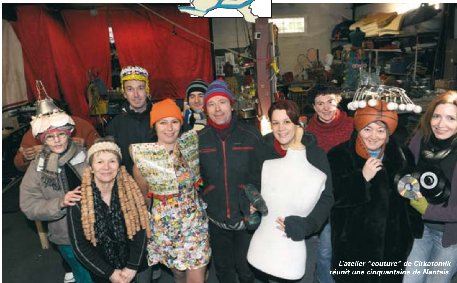
L'atelier "couture" de Cirkatomik réunit une cinquantaine de Nantais.