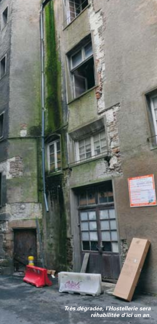
Très dégradée, l'Hostellerie sera réhabilitée d'ici un an.