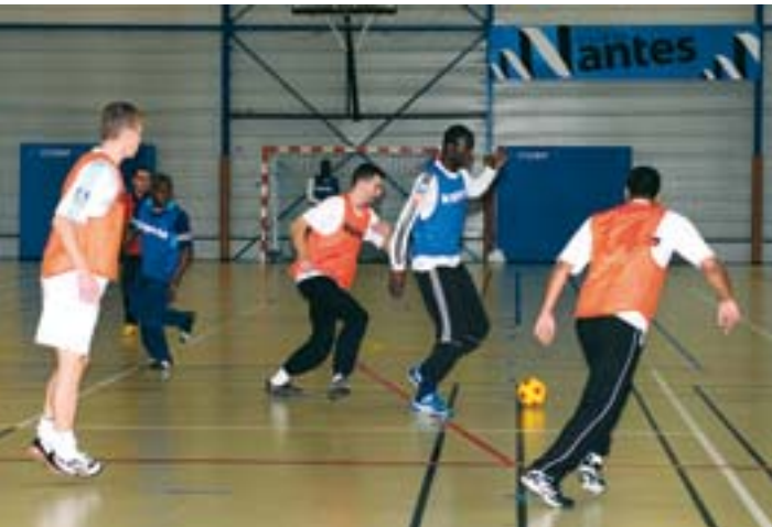
Venus du Breil et des Dervallières, les joueurs de futsal se retrouvent au gymnase Coubertin.