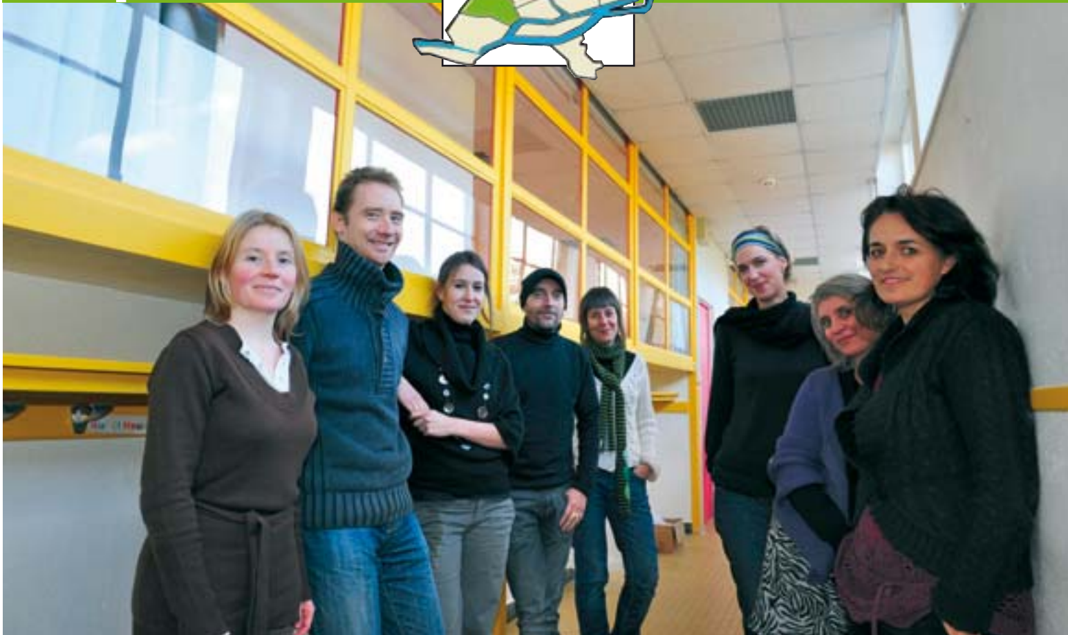
Les nouveaux occupants de l'école élémentaire Dervallières Château, transformée en laboratoire artistique.