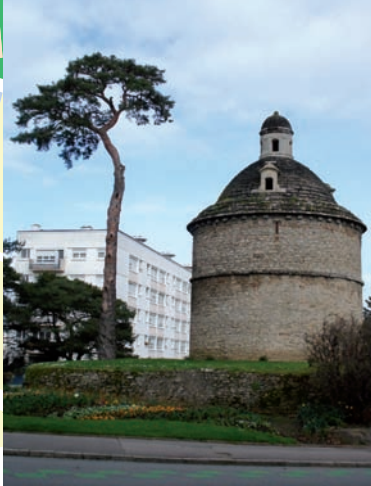
Le Pigeonnier, place Vincent Auriol