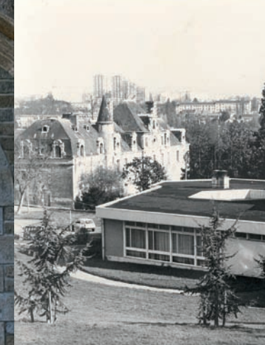
Le château des Dervallières dans la cité (années 60)

« En arrivant aux Dervallières, ça a été la découverte d'un paradis pour moi et pour ma famille. » Témoignage d'une habitante