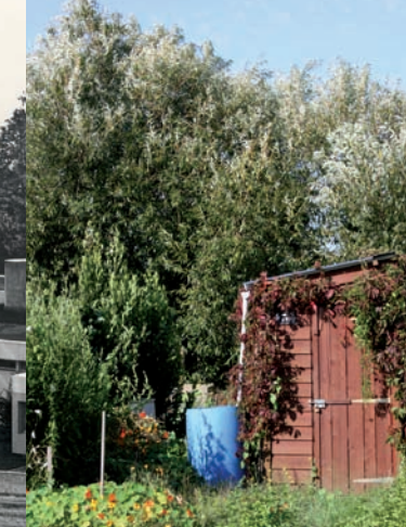
Les jardins de la Fourmillière