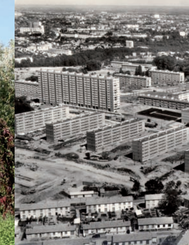
La ZUP des Dervallières (années 60)

La rénovation du bassin programmée à l'automne 2007 s'inscrit dans la logique des