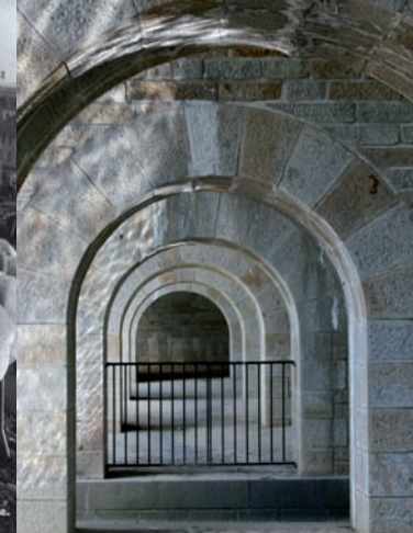
Le pont Jules César

La cité des Dervallières naît dans un contexte de pénurie d'habitat, à un moment de forte croissance démographique. L'architecte Marcel Favreau crée l'un des 1 ers