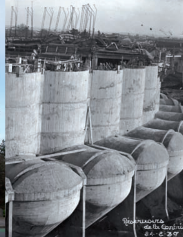
La construction des réservoirs, 1936-1937