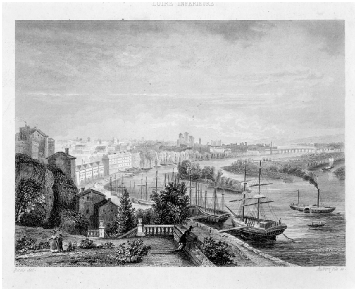
Le port de Nantes vu de l'Hermitage, (gravure de Aubert fils, d'après un dessin de Ricois).