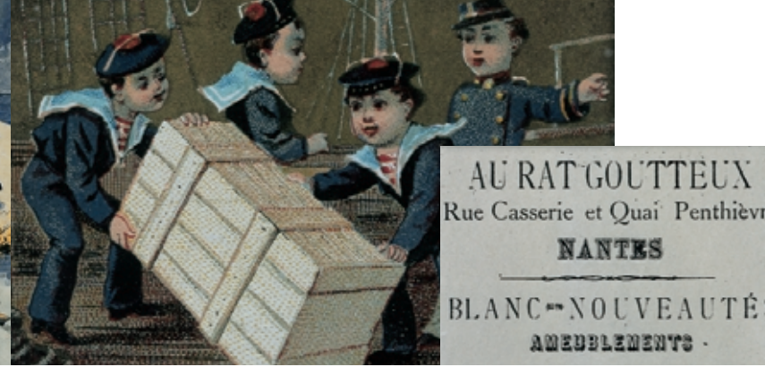
Publicité pour le magasin "Au rat goutteux"

"Il y a cette circonstance que je suis né à Nantes, où mon enfance s'est tout entière écoulée [...]"*