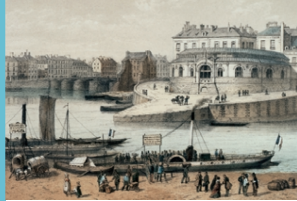
La Poissonnerie à Nantes, située à l'une des pointes de l'île Feydeau où Jules Verne est né.