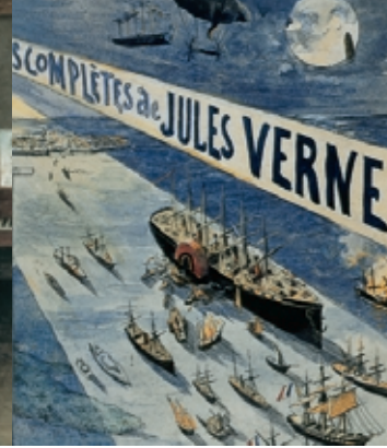
Affiche de Georges Roux pour les Œuvres complètes de Jules Verne - 1909