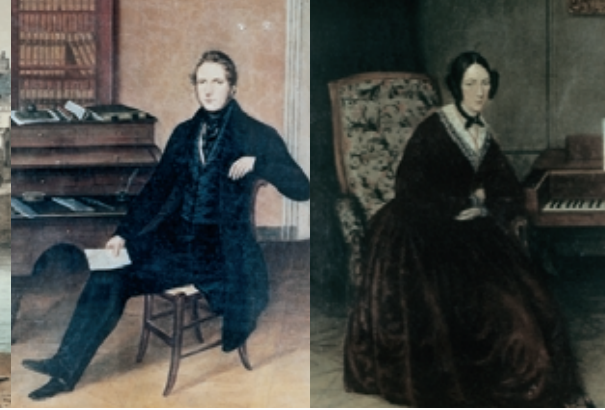
Pierre Verne et Sophie Allotte de la Fuye, parents de Jules Verne.