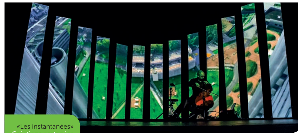
«Les instantanées» Créations partagées

Les ateliers Bonus, 36 mail des chantiers (ilot des îles) ■