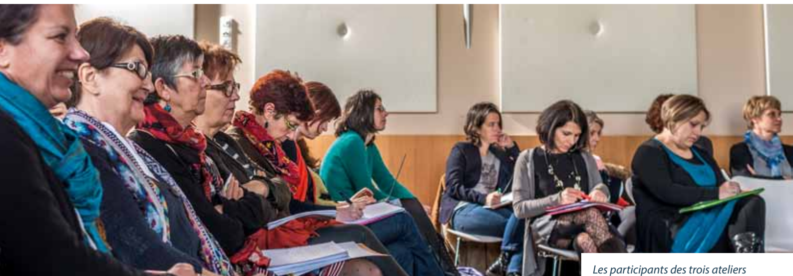
Les participants des trois ateliers restituent leur travail aux élus nantais, le 24 février 2015