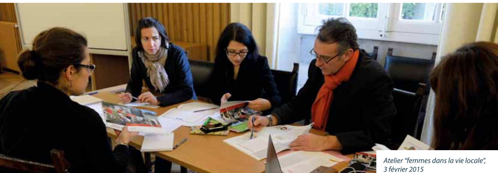
Atelier "femmes dans la vie locale", 3 février 2015