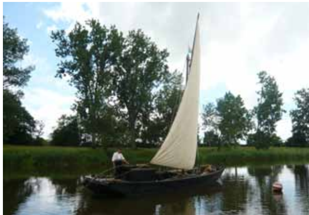
La Juste est une toue construite en 1977 qui assurait le transport d'animaux sur les îles de la Loire. Ce type de bateau à fond plat très caractéristique pouvait également servir à la pêche. Il était facile de les adapter à tous types d'usages.