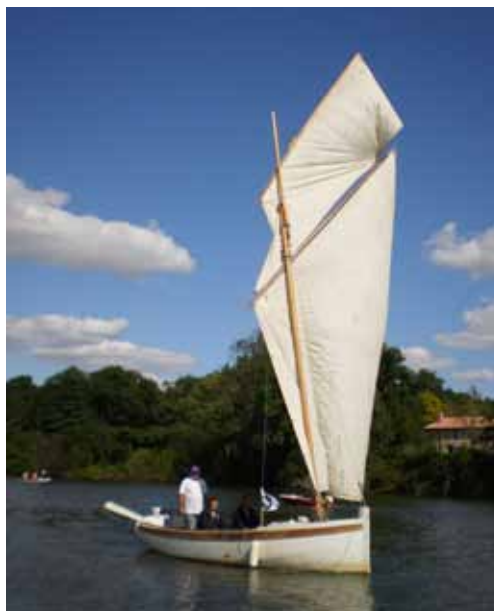
Reine de Cordemais est un canot « basse-indrais » (du nom de Basse-Indre, commune à l'ouest de Nantes) labellisé Bateau d'Intérêt Patrimonial et propriété de l'association nantaise La Cale2 l'Île. Ce canot est souvent de sortie lors des manifestations nautiques locales. Ce type de bateaux est bien représentatif de la flotte des bateaux de pêche de l'estuaire.