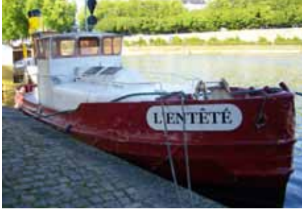
L'Entêté, construit par les Chantiers Merré de Nort-Sur-Erdre, en 1967, est un remorqueur des sabliers de Loire. Il est en cours de labellisation « Bateau d'Intérêt Patrimonial ».

Ces petits bateaux puissants sont représentatifs des activités du port aidant à la manœuvre des navires plus grands. Les remorqueurs à vapeur, puis à moteurs diesel, sont très actifs dans le port au 19 e et 20 e siècle.