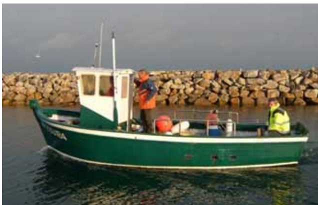
Étoile Verte est un ancien civellier de Loire (bateau de pêche de civelles : petites anguilles) construit aux chantiers Bézier à Rezé en 1969 et labellisé Bateau d'Intérêt Patrimonial depuis 2011.

La pêche en Loire fut également très active et alimentait les nombreux marchés et criées du centre de la ville, en civelles (larves d'anguilles), brochets, lamproies... Les bateaux fluviaux sont plus modestes et « taillés » pour le fleuve (fond plat, évitant l'enlisement dans les sables). Différents types de bateaux sont encore visibles dans la région, comme les toues, bateaux en bois à fond plat, souvent surmontés d'une cabane, ou encore les canots « basse-indrais », d'une longueur de 5 à 7 mètres, équipés d'un hunier (voile basse de forme carrée) et qui, les jours de relâche, participaient souvent à des courses sur l'eau, les régates.